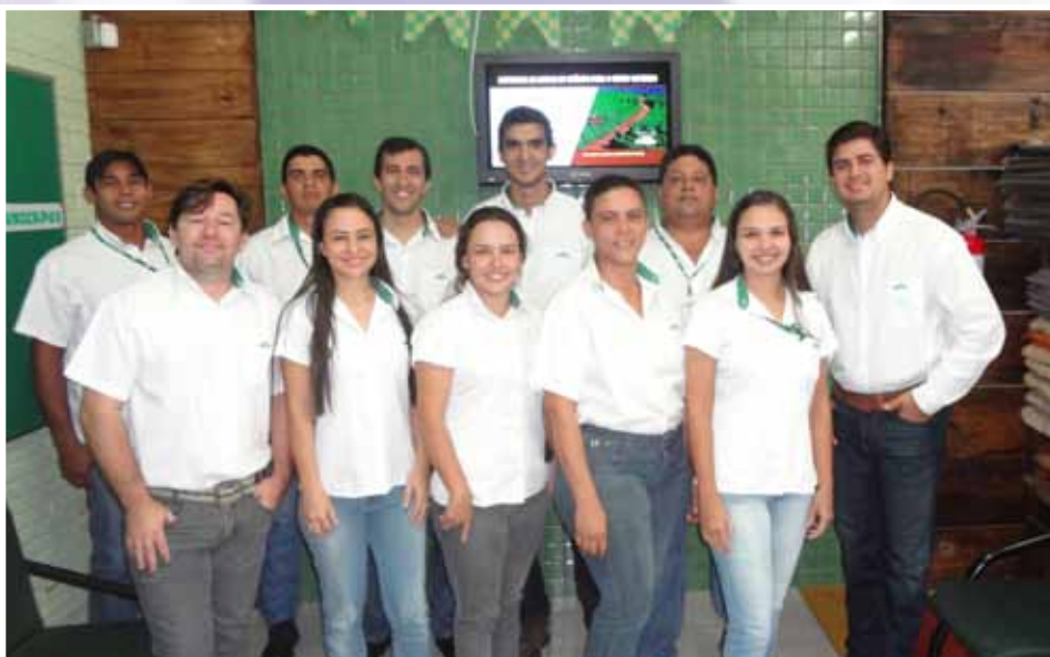
Data de fundação: 13 de agosto de 2008 - Endereço: Rua Marechal Mallet, 1.020 e-mail: aquidauana@camda.com.br - telefone: (67) 3240.2000