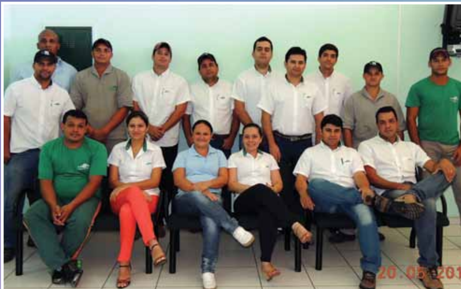
Data de fundação: 8 de agosto de 2000 - Endereço: Av. Eng. Marcelo Miranda Soares, 1.335 e-mail: paranaiba@camda.com.br - telefone: (67) 3668-2683