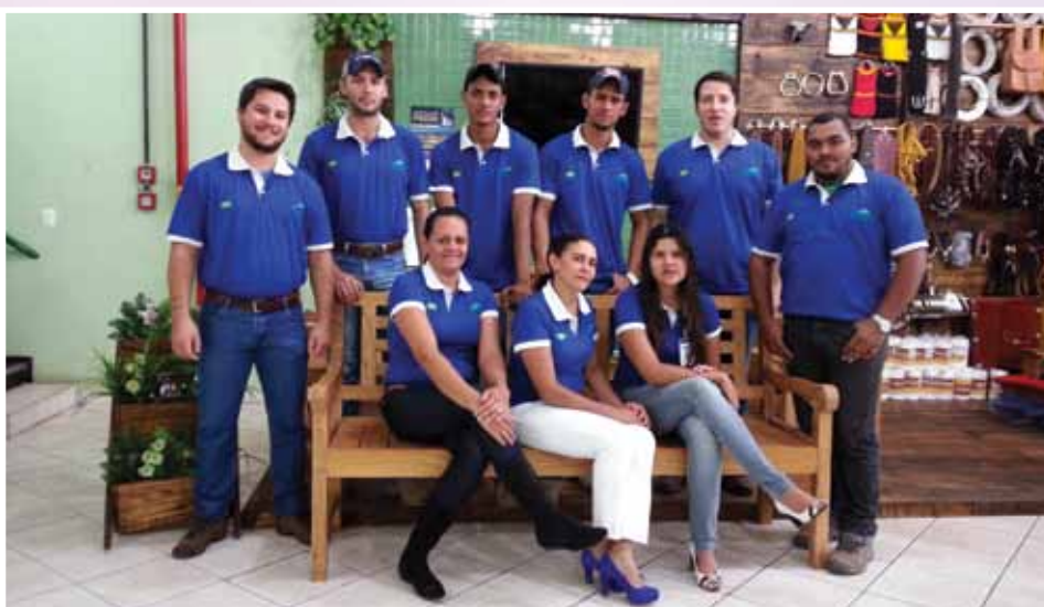
Data de fundação: 18 de agosto de 2008 - Endereço: Avenida Virgínia Ferreira, 374 e-mail: coxim@camda.com.br - telefone: (67) 3291.0800